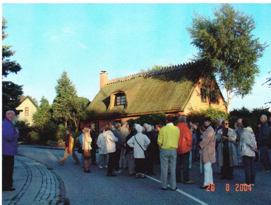
En gruppe deltagere ved et af landsbyens gamle huse

Det blev en fantastisk aften med ca. 135 deltagere. Det betød at vi måtte inddеле deltagerne i 3 grupper så alle kunne høre hvad der blev sagt.